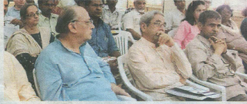
Report says the state's economy is booming, but it is being encashed by a few people

A research report brought out by Behavioural Science Centre of St Xavier's College has come down heavily on the state government's land acquisition policy. As per the detailed study, despite all the rhetoric about Gujarat's economic boom, the reality is that these developments has only helped a selected few industrialists and urban elite.